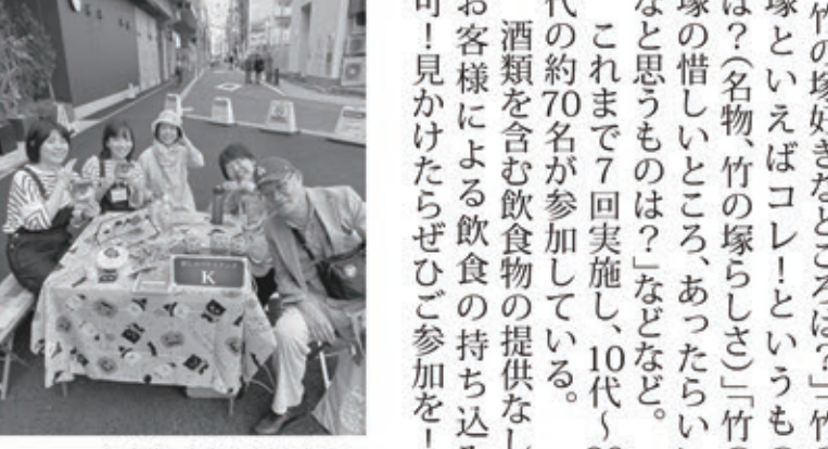
SDGs 未来都市推進担当課