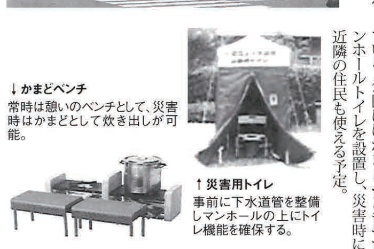
かまどベンチ 常時は憩いのベンチとして、災害時はかまどとして炊き出しが可能。 災害用トイレ 事前に下水道管を整備しマンホール上にトイレ機能を確保する。